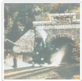
Franz Michael Felder