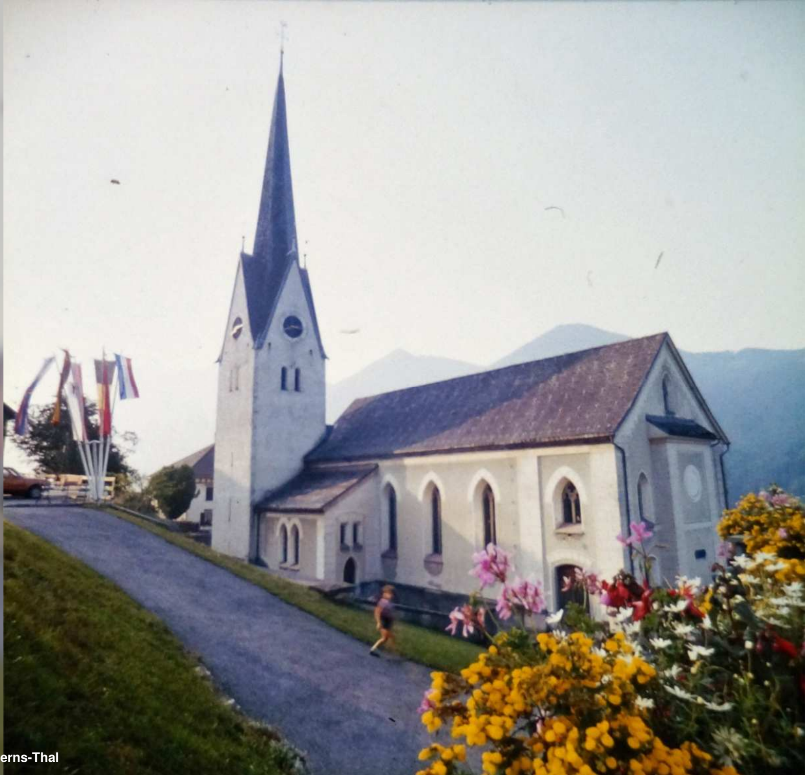
11. Pfarkirche von Laterns-Thal